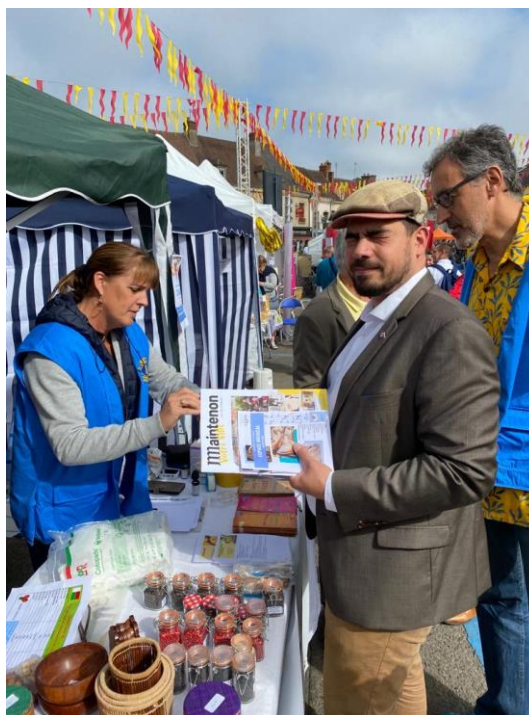
Monsieur Guillaume Kasbarian, Député.